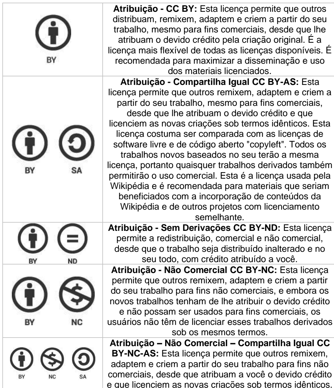
Tabela 2: Tipos de licenças CC.