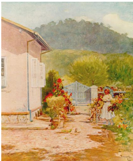
Minha casa em Teresópolis (1932) – Eliseu Visconti.

e a brasileira Georgina de Albuquerque (1885-1962), pintores que podem ser filiados ao Impressionismo, no nosso país. Na sequência, exemplificamos o que foi afirmado em uma pintura de Visconti: