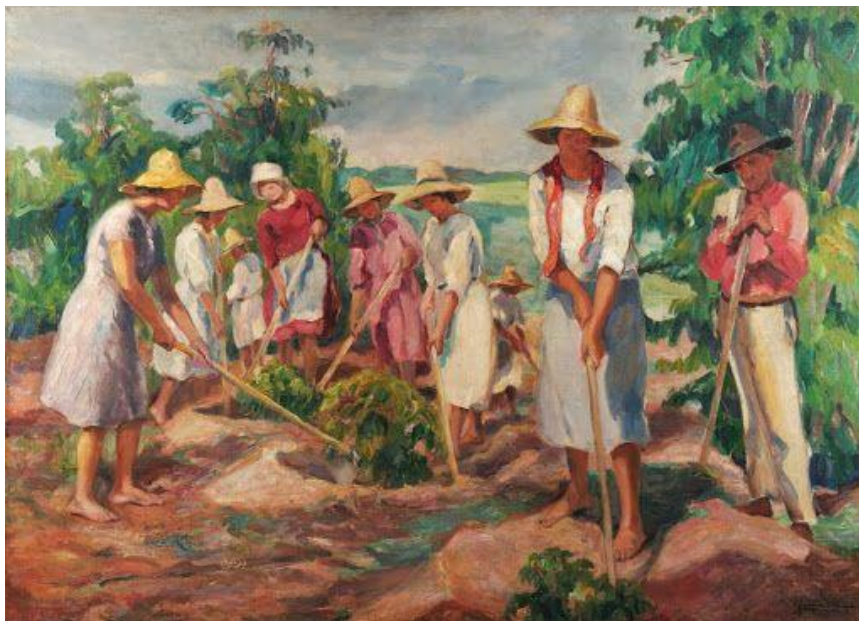
No cafezal (1930) – Georgina de Albuquerque.

No prosseguimento de nosso artigo, trazemos um quadro de Georgina Albuquerque 7 , no qual os efeitos da luz solar também são intensos e incidem sobre as personagens retratadas: